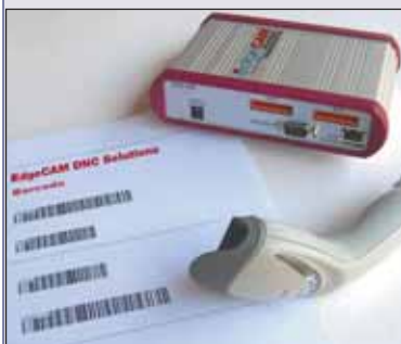
Sistema Edgecam DNC.

Sgrossatura di gole su macchina multitask.